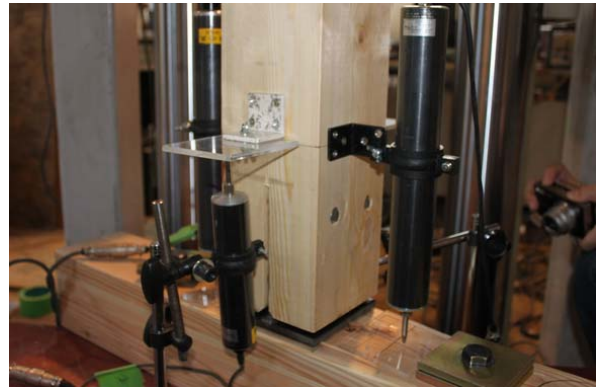
【木造住宅の耐震構造】