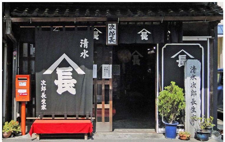
【清水次郎長の生家】