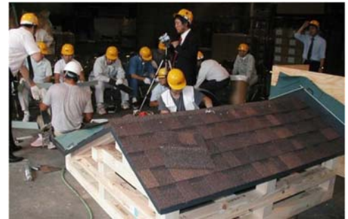
【模型を利用した住宅耐震化の技術講習】