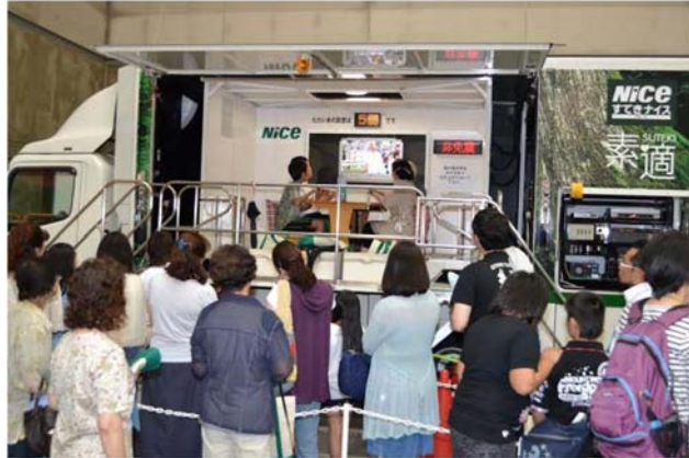
【地震体験車による地震体験の様子】