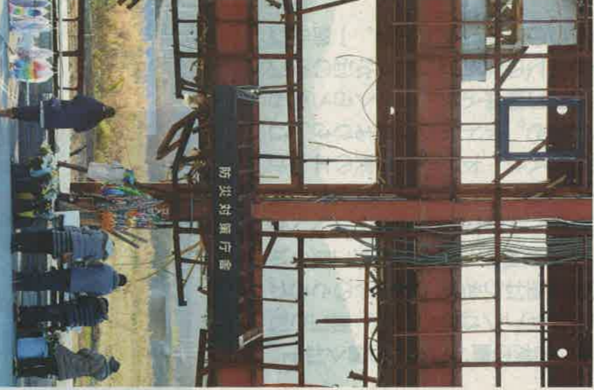
43人が犠牲となった防災対策庁舎では、今も多くの人が訪れ手を合わせている

東日本大震災の「震災遺構」と同様、先人たちも津波の記憶を将来に残す方法を考えていた。その一つが、石碑だ。